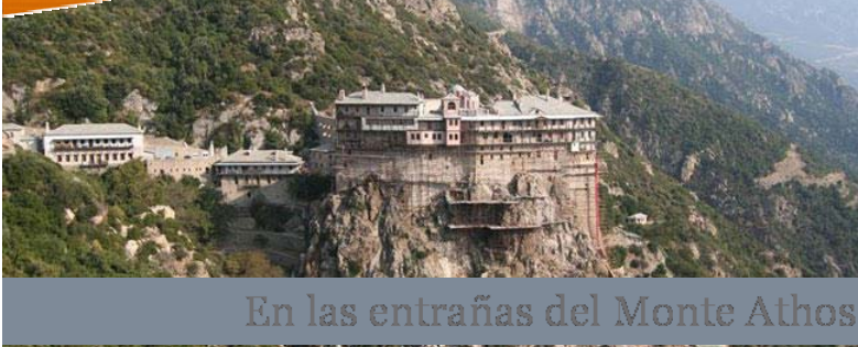
En las entrañas del Monte Athos