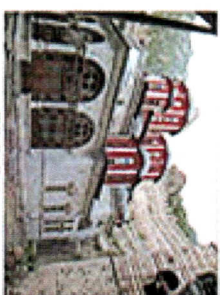
El Iviron, Grecia. El mar de Egeo al fondo.